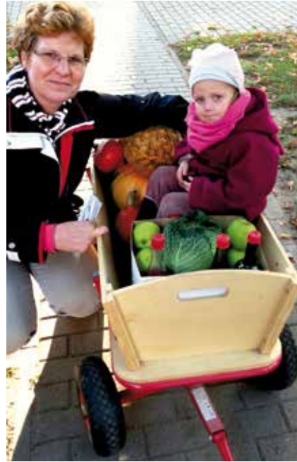
Mit dem Bollerwagen von Haus zu Haus: die Erntegabensammlung in Diedersdorf