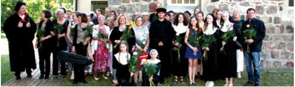
Ein erfolgreiches Team brachte am 16. Juni Luthers Leben als Musical zur Aufführung